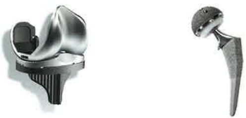
人工膝関節インプラントの一例