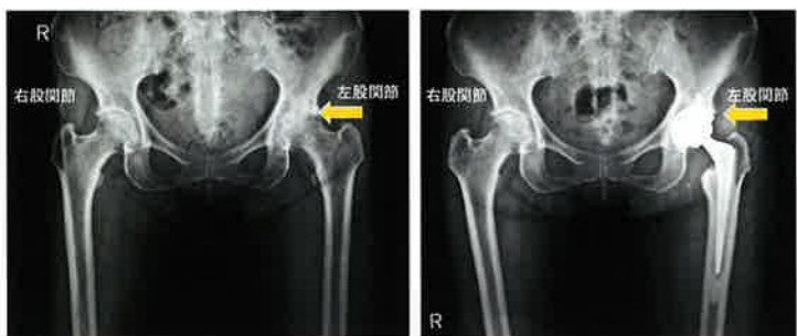
前から見た左変形性股関節症のレントゲン写真 右側と比較して隙間が狭くなっています