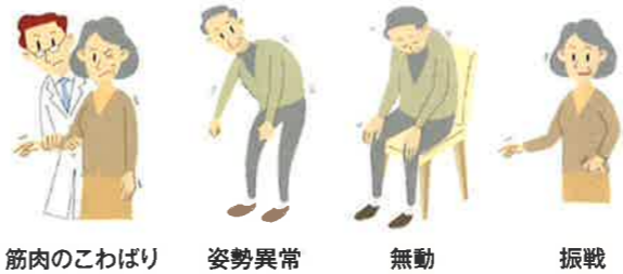
筋肉のこわばり 姿勢異常 無動 振戦