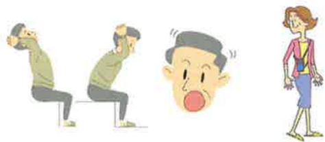
ストレッチ 発声練習