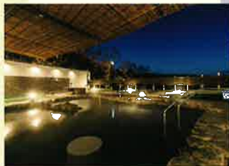
大露天風呂の夜景