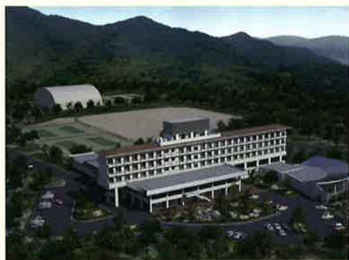
銀河の湯(みのたにグリーンスポーツホテル)

神戸電鉄・北神急行電鉄谷上駅の北西、小高い丘陵地に位置する「神戸天空リゾートみのたにグリーンスポーツホテル」は、グラウンドやテニスコート、多目的ドームなどを備えたスポーツガーデン。企業や学校、団体等の合宿やセミナー施設としても親しまれており、付属する温泉利用施設「銀河の湯」からは、昼間は眼下に広がる北神戸の緑、夜になればその名の通り、天空にきらめく銀河の星々が満喫できる。23時まで営業しているため、時には露天風呂でのんびり夜空を楽しんでみよう。泉質はラジウム成分を含んだ刺激が少ない単純温泉。大露天風呂のほか、屋内大浴場、ジェットバス(寝湯・気泡浴)、サウナ、つぼ湯、うたせ湯など、入浴設備も充実している。ホテル内にはレストランやバーベキューガーデン(夏季のみ営業)などもあり、家族連れでの行楽にもおすすめです。