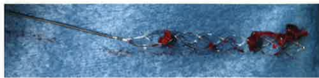
脳の血管の中に血栓回収用のカテーテルを誘導し展開しているところ(上)と、血管の中から回収してきた血栓(下)。