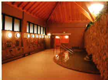
岩風呂をイメージした浴室

泉質等 ／炭酸泉(炭酸水素塩泉)、ラジウム泉(単純放射能泉) 効能 ／神経痛、筋肉痛、関節痛、五十肩、運動マヒ、うちみ、くじき、慢性消化器病、痔疾、慢性皮膚病、疲労回復など