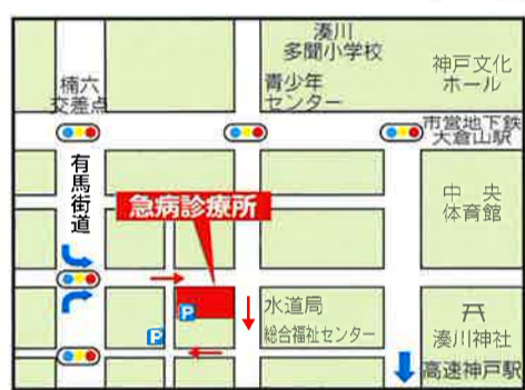
内科は原則高校生(15歳以上)以上