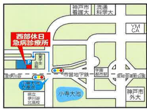
内科は原則高校生(15歳以上)以上